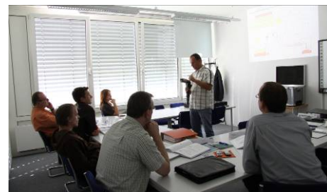
Abb.: Ausbildung in der Dürr Somac Filling Academy

Wir haben uns verpflichtet, unser Know-how in der Befülltechnik durch die „Dürr Somac Filling Academy“ auch an unsere Kunden weiterzugeben. Die Schulung der Mitarbeiter unserer Kunden unterstützt den sachgemäßen Umgang und eine ordnungsgemäße Wartung der Technik.