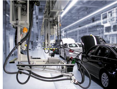
Abb.: Kombibefüllanlage bei BMW in Leipzig

Kernkompetenz von Dürr Somac ist, Fahrzeugsysteme entsprechend der Anforderungen der Kunden an Prozess und Taktzeit unter Produktionsbedingungen zu testen und zu befüllen. Die Anlagentechnik gewährleistet ein Höchstmaß an Qualität und Zuverlässigkeit unter Beachtung der gesetzlichen Auflagen des Gesundheits- und Umweltschutzes.