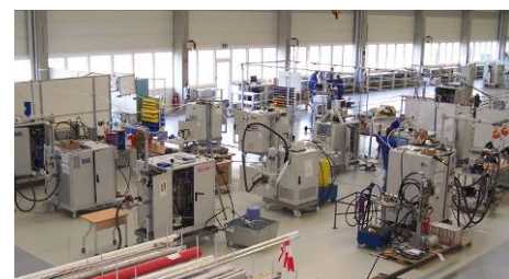
Abb.: Produktionshalle Dürr Somac

Mit der Befülltechnik wurde 2014 ein Geschäftsvolumen von ca. 60 Mio. Euro mit weltweit ca. 250 Mitarbeitern; davon sind in Stollberg ca. 190 Mitarbeiter beschäftigt, erwirtschaftet. Bereits 1992 hat Dürr Somac erste Anlagen nach China geliefert. Heute werden auch in der Produktionsstätte von Dürr Somac in Shanghai Befüllanlagen hergestellt und unsere chinesischen Mitarbeiter unterstützen unsere Kunden bei den Projekten vor Ort. Mit mehr als 20 Vertretungen und Servicestützpunkten weltweit sind wir in allen wichtigen Märkten präsent. Dürr Somac beliefert die Automobilhersteller in über 30 Ländern der Welt. Unsere Maschinen und Mitarbeiter sind Botschafter der guten sächsischen Maschinenbautradition.