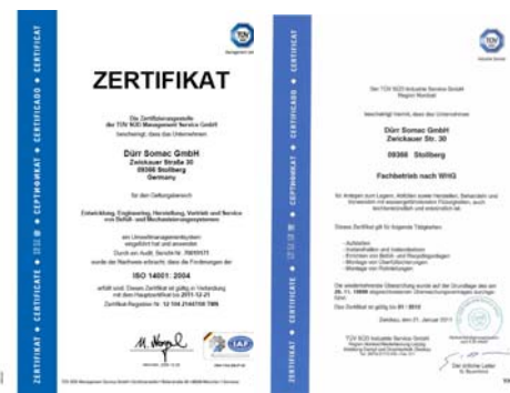
Abb.: Energie Label und zertifiziertes Umweltmanagement